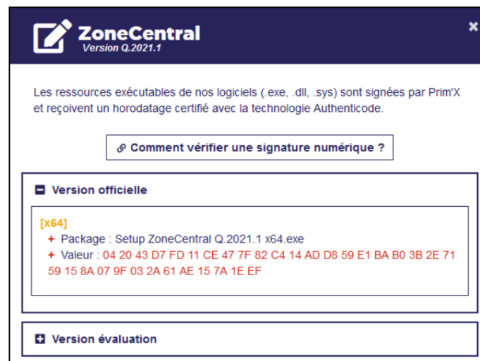
Figure 1 : signature disponible sur le site web du développeur