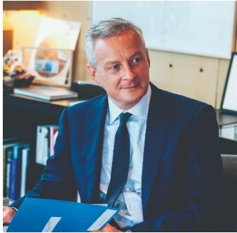
Bruno Le Maire Ministre de l'Économie, des Finances et de la Relance.

À la fois essentielle à la souveraineté des Etats, à la pérennité du développement des entreprises et à la sécurité des citoyens, la cybersécurité est un enjeu majeur du XXI siècle.