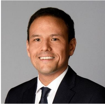
Cédric O Secrétaire d'Etat chargé de la Transition numérique et des Communications électroniques.

A la fois moyen de communication, outil de travail et demain pilote de nos véhicules autonomes, le numérique imprègne chaque jour un peu plus notre vie quotidienne. Les outils numériques apportent avant tout un bénéfice à qui sait les maîtriser, mais leur développement nous a aussi rendus plus vulnérables face aux attaques cyber. Il est donc du rôle de l'Etat d'accompagner la prise de conscience des utilisateurs du numérique face à ce risque, les aider à s'en prémunir, et soutenir le développement d'une filière française de la cybersécurité.