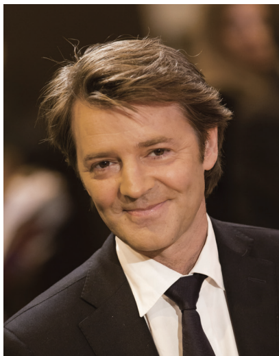
François BAROIN Président de l'AMF

Les communes et les intercommunalités sont engagées, comme le reste de la société, dans une profonde transformation numérique. En particulier, leurs échanges dématérialisés avec les citoyens, les acteurs économiques et les administrations publiques se sont multipliés. Dans le même temps, elles sont aussi devenues, ces derniers mois, des cibles d'attaques informatiques de plus en plus nombreuses.