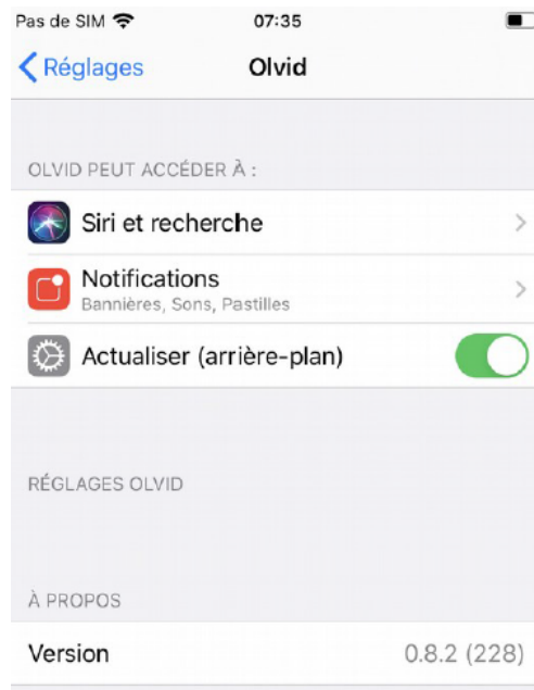
Figure 3 - Version de l'application depuis les réglages du téléphone